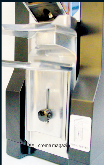
Unten: Über das Rädchen kann die Siebträgergabel schnell und unkompliziert für jeden Siebträger justiert werden.