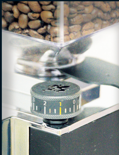
Oben: Das größere Stellrädchen der Oro-Serie ermöglicht eine präzise Mahlgradeinstellung.